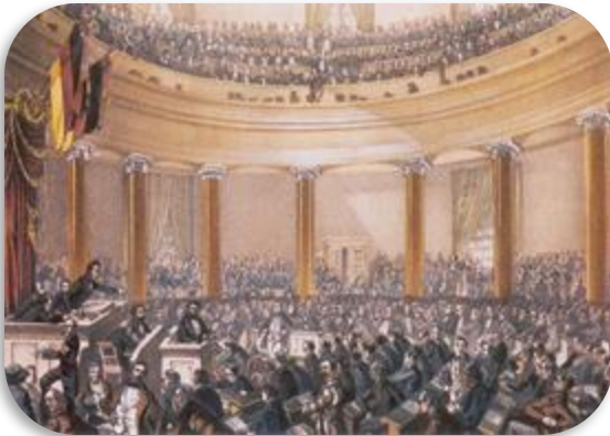
Sitzung der Nationalversammlung im Juni 1848